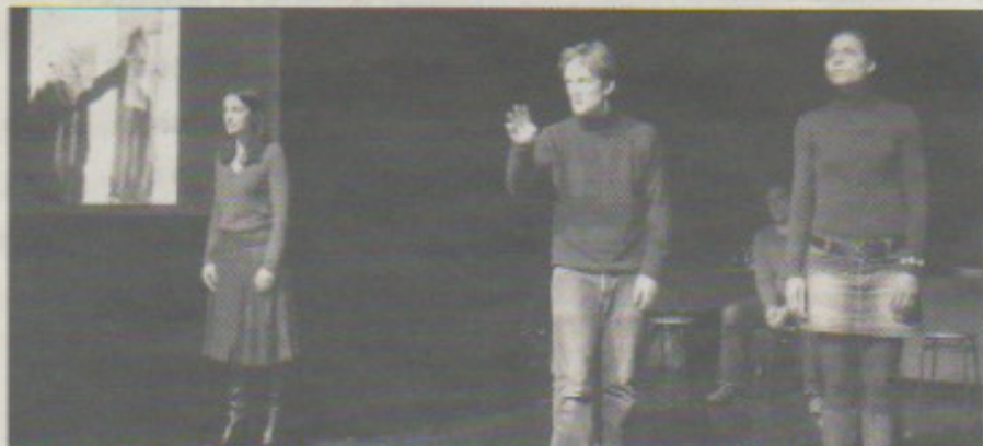
La compagnie In Cauda jouera le texte « Quatre-vingt-treize ce soir ».